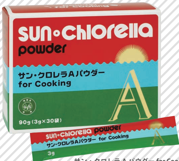
サン・クロレラ A パウダー for Cooking

クロレラは植物プランクトンの仲間、体に必要不可欠な栄養素をバランスよく含んでいます。そんなクロレラを微粒子パウダーにしました。いつものお料理にさっと加えるだけで、簡単に栄養バランスアップ！さらにコクと旨味も増すので美味しさもアップ！