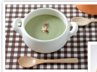
シチューやスープに！