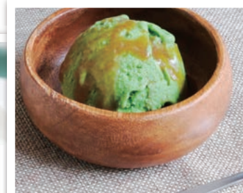
アイスクリームに！